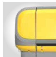
GELB RAL 1018