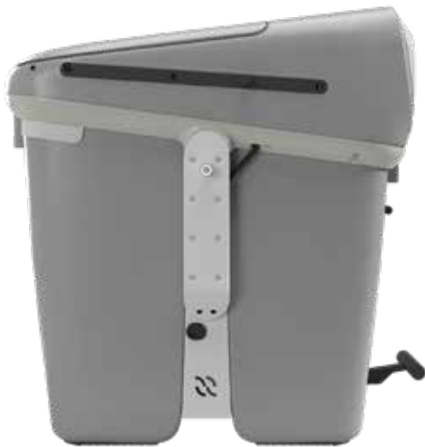
GRAU RAL 7037