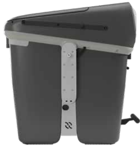
VERKEHRSGRAU RAL 7043