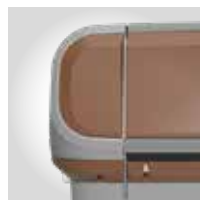
BRAUN RAL 8024