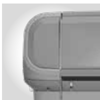
GRAU RAL 7037