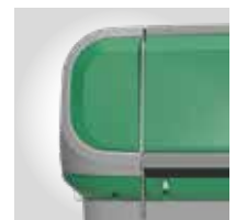
GRÜN RAL 6032