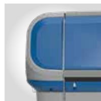
BLAU RAL 5005