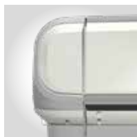
ACHATGRAU RAL 7038