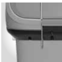
TIEFSCHWARZ RAL 9005