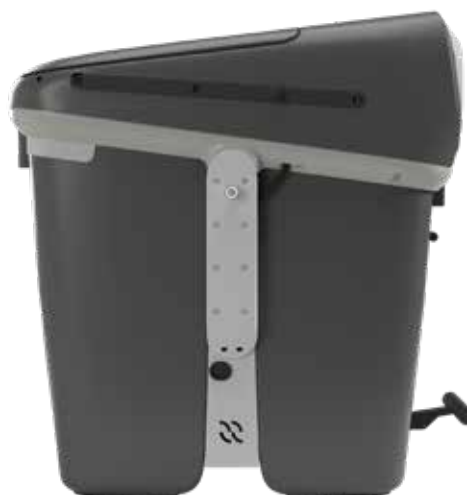
GRIS OSCURO RAL 7043