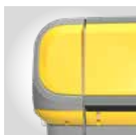
AMARILLO RAL 1018