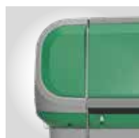
VERDE RAL 6032