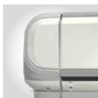
GRIS RAL 7038