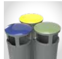
Fraktionskennzeichnung mit farbigen Deckeln