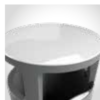
Tapa de aluminio