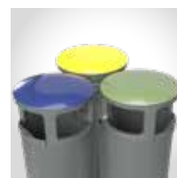
Tapas de color