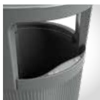
Extintor de cigarrillos