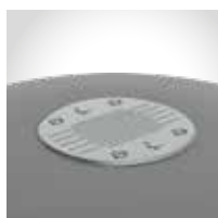
Extintor en tapa