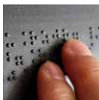
Dispositivo táctil en Braille, con tipo de residuo