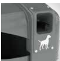
Expendedor de bolsas caninas