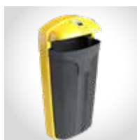
Identificación de fracción con tapa de color