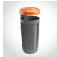
Fraktionskennzeichnung mit farbigem Deckel