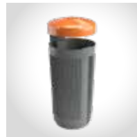
Étiquetage des fractions avec couvercle coloré