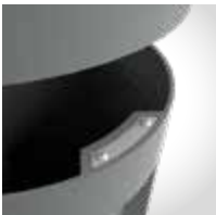
Extincteur de cigarettes