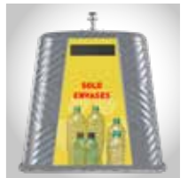
Auf Anfrage (Bild zeigt Beispiel)