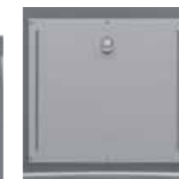
Großverbraucher- klappe, erweiterte Sortieranleitung (ohne Schloss)