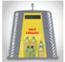
Ejemplo de personalización