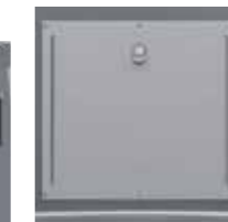
Trappe gros producteur, Extension Consignes De Tri