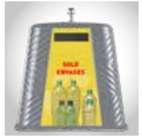
Consignes De Tri (exemple)