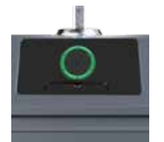
Trappe Gros Producteur Verre