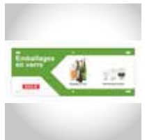
Consignes De Tri (exemple)