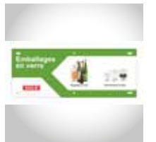
Auf Anfrage (Bild zeigt Beispiel)