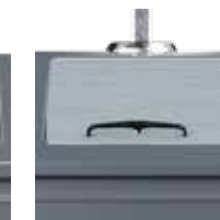
Restmüll RAL 7011