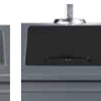
Großverbraucher- klappe, erweiterte Sortieranleitung (ohne Schloss)