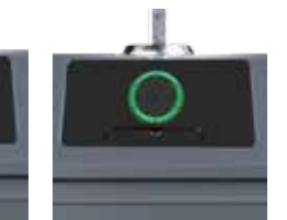
Großverbraucher- klappe Glas