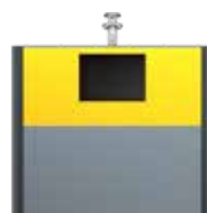
Extension Consignes De Tri EPDM Jaune Zinc RAL 1018