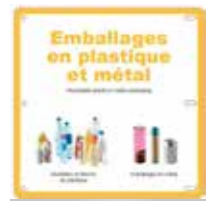
Ejemplo instrucciones de reciclaje