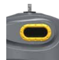
Envases Amarillo Zink RAL 1018