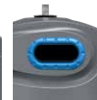
Papel Azul Cielo RAL 5015