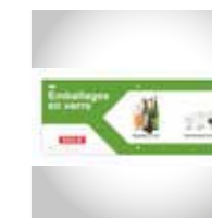
Ejemplo de instrucciones de reciclaje