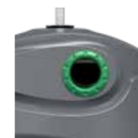
Verre Vert RAL 6010-6018