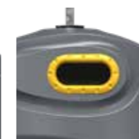
Emballage Jaune Zinc RAL 1018