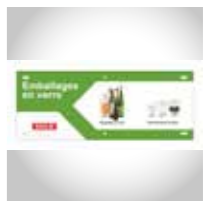
Consignes De Tri (exemple)