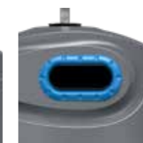
Papier Bleu Ciel RAL 5015