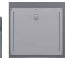
Trappe Gros Producteur