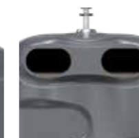
OM Gris Fer RAL 7011