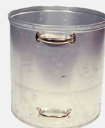
Separater Stahlzusatzbehälter für besonders sicheres Handling von beispielsweise Dosen und Gläsern nach der Verdichtung.