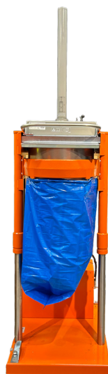
Standardhöhe für die Entleerung 2.660 mm

Als Top-Lader ist die Presse einfach zu befüllen. Sie ist sicher und einfach zu bedienen und macht den Sackwechsel mit ihrer eingebauten Hebefunktion denkbar schnell und bequem.