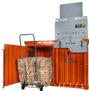
Optional mit Mehrfachabbindung – passend zu Anforderungen von Material und Handling.

Während in der einen Kammer noch verdichtet wird, kann die andere Kammer schon wieder mit neuem Material gefüllt werden. Das Ergebnis ist eine