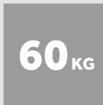
BALLEN- GEWICHT KARTONAGE