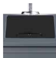
Trappe Gros Producteur , verre, emballage, Papier Carton, Extension Consignes De Tri (avec serrure)