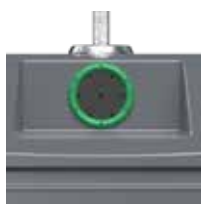
Verre Vert RAL 6011