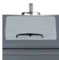
OM Gris Fer RAL 7011