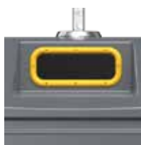
Emballage Jaune Zinc RAL 1018