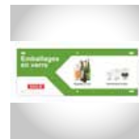
Consignes De Tri (exemple)