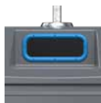
Papier/ Carton Bleu Ciel RAL 5015