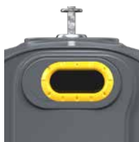
Emballage Jaune Zinc RAL 1018