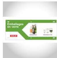
Consignes De Tri (exemple)