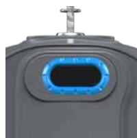
Papier Bleu Ciel RAL 5015