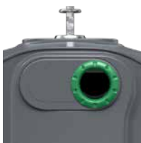
Verre Vert RAL 6011