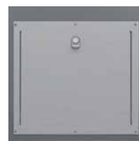
Trappe Gros Producteur