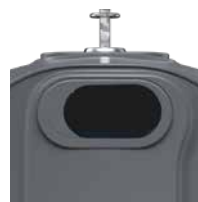
OM Gris Fer RAL 7011