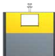
Extension Consignes De Tri Alu Jaune Zinc RAL 1018