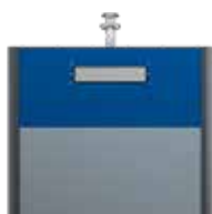
Papier Alu Bleu De Sécurité RAL 5005