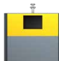
Extension Consignes De Tri EPDM Jaune Zinc RAL 1018