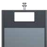
OM Alu Gris ardoise RAL 7015