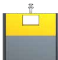
Emballage Jaune Zinc RAL 1018