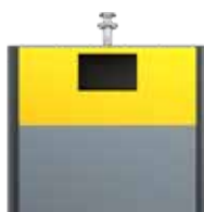
Emballage EPDM Jaune Zinc RAL 1018