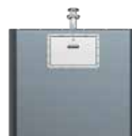
Trappe Gros Producteur