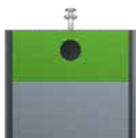
Verre Vert Jaune RAL 6018