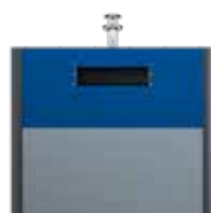
Papier EPDM Bleu De Sécurité RAL 5005