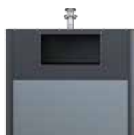
OM EPDM Gris ardoise RAL 7015