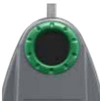
Verre Vert RAL 6011