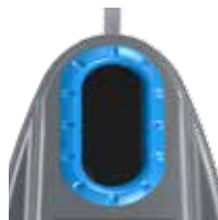
Papier Bleu Ciel RAL 5015