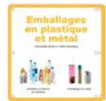
Consignes De Tri (exemple)