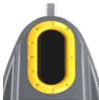
Emballage Jane Zinc RAL 1018