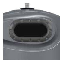
OM Gris Fer RAL 7011