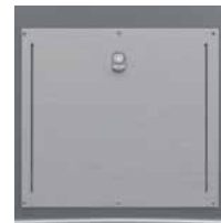
Trappe Gros Producteur