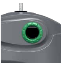
Verre Vert RAL 6011