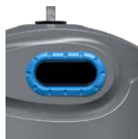
Papier Bleu Ciel RAL 5015