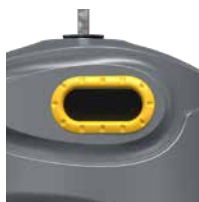
Emballage Jaune Zinc RAL 1018