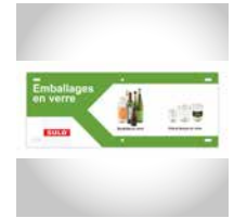
Consignes De Tri (exemple)